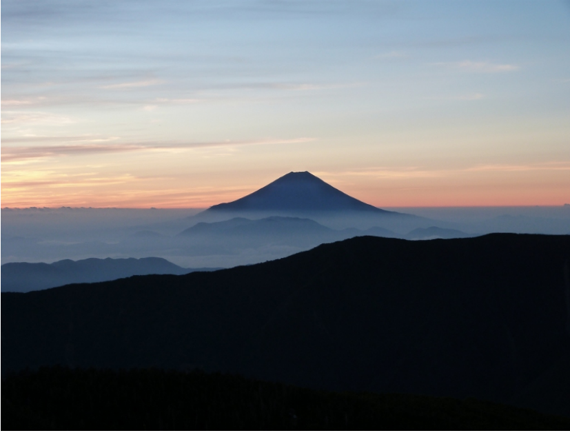
千枚小屋から朝焼けの富士山