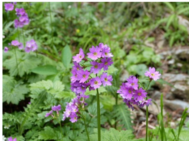
千枚小屋の手前にハクサンコザクラが!